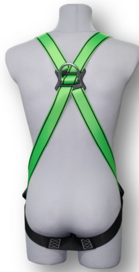
Abb. MB10-E Rückseite